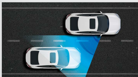
Exclusivo Sistema Honda LaneWatch™.

O conjunto de suspensões é um grande diferencial para quem procura performance e estabilidade ao dirigir. Além das Suspensões Dianteiras MacPherson com barras estabilizadoras, o Honda Civic vem de série com Suspensão Traseira Multi-Link também com barras estabilizadoras que garantem conforto diferenciado e dirigibilidade excepcional.