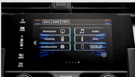
Multimídia de 7" com Navegador, Interface para Smartphone.

Nas versões EXL e Touring , a Central Multimídia ainda agrega navegador GPS . E, para seu total conforto, a versão Touring ainda possui carregador por indução (wireless) no console central. Basta apoiar o seu smartphone 2 e, sem a necessidade de nenhum fio, o aparelho passa a ser carregado.