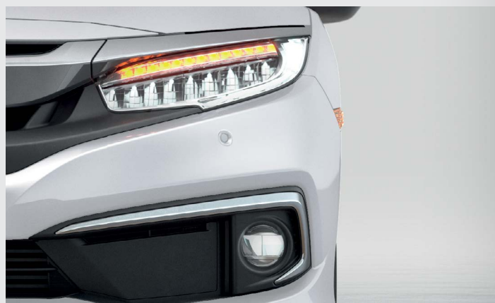
Faróis Full LED.