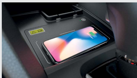
Carregamento por Indução (wireless).