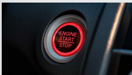
Botão de Partida do Motor (Start/Stop).