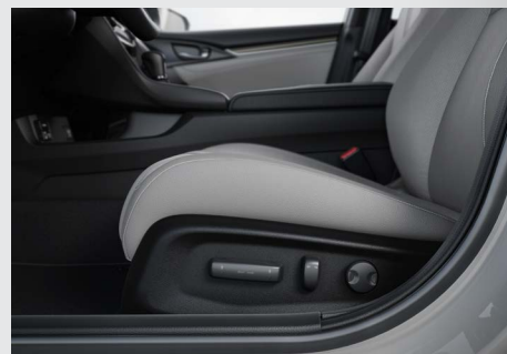
Banco do motorista com ajuste lombar e regulagens elétricas.