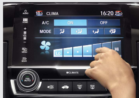
Ar-Condicionado Digital com Função Dual Zone.

A partir da versão EX o modelo já conta com retrovisor interno eletrocromático (antiofuscamento) . As versões EXL e Touring agregam sensor de chuva para acionamento automático dos limpadores de para-brisa e chave Smart Key . A versão Touring adiciona partida no motor a distância, para-brisa com isolamento acústico e o banco do motorista com ajuste lombar e regulagens elétricas para maior conforto.