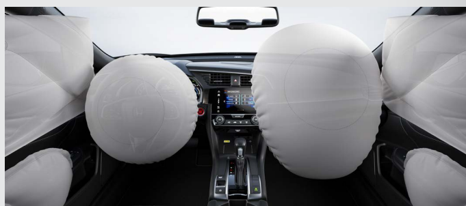
6 Airbags (2 frontais, 2 laterais e 2 de cortina).

Projetado para o seu conforto, o Honda Civic possui câmbio de transmissão automática do tipo CVT (Continuamente Variável) e, a partir da versão Sport , Paddle Shift de 7 velocidades que combinados proporcionam uma condução suave, com respostas mais precisas e aceleração linear.