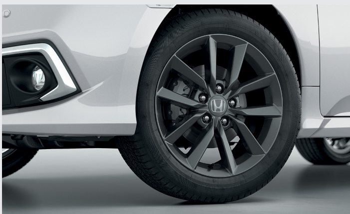
Rodas de Liga Leve.