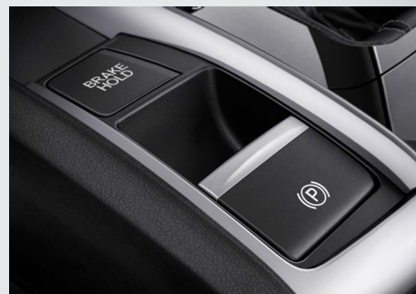
Freio de Estacionamento Eletrônico (EPB) com Função Brake Hold.